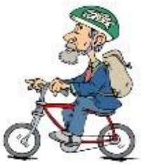
ride a bicycle