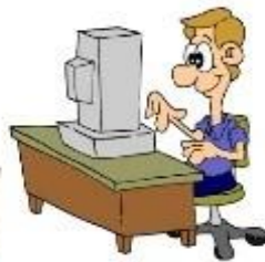
surf the net