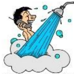
have a shower