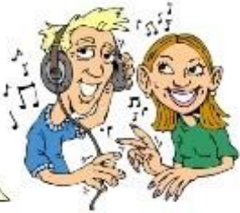
listen to music