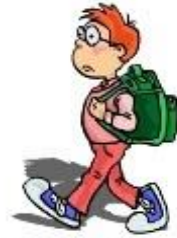
walk to school