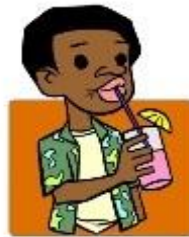
drink fruit juice