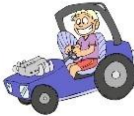
drive a car