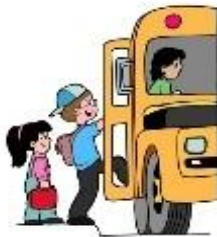
get on the bus